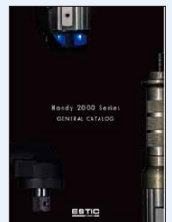
Handy 2000 Series GENERAL CATALOG